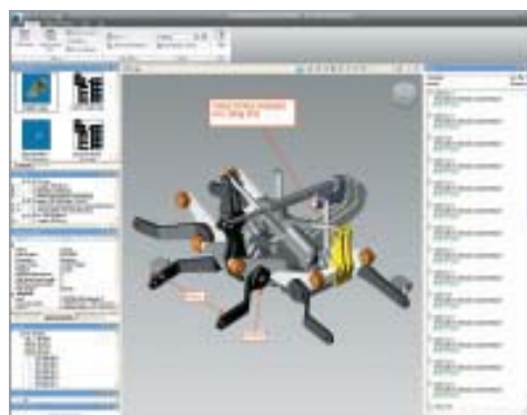
Les annotations créées sur les modèles restent toujours disponibles pour référence.